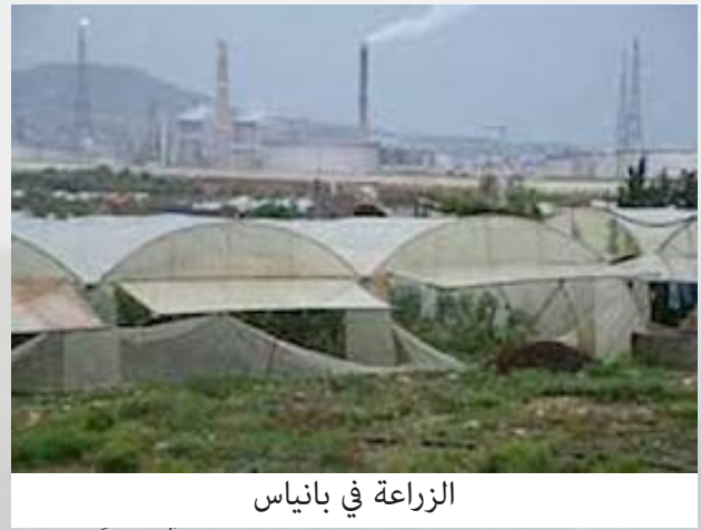
الزراعة في بانياس

سكان المناطق القريبة من الشاطئ، مثل الرملة وقصر تحوف والقيبات. والزراعة. ويوجد تمييز طائفي في الوظائف الرسمية بالمدينة كالبلدية والمالية ودائرتي النفوس والعقارات؛ إذ لا تُمنح إلا لأبناء الطائفة