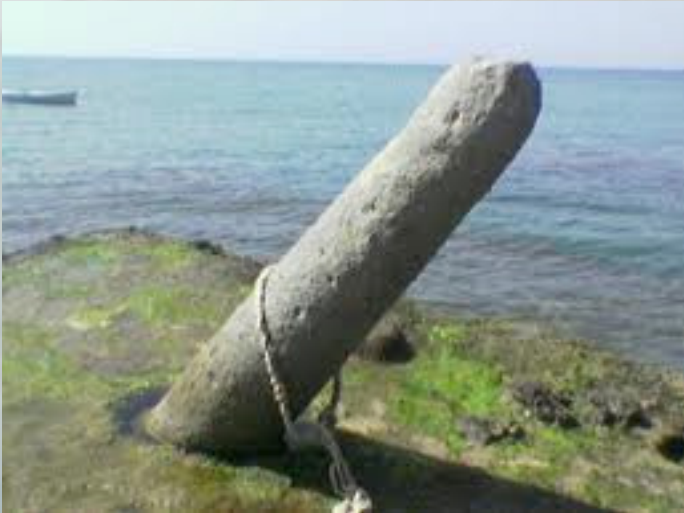
رُمح علي رضي الله عنه

وبواطيس وقطعاً مختلفة تعود إلى العصور الرومانية والإسلامية والصليبية.