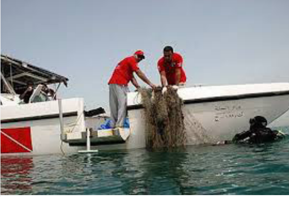
الصيد في بانياس

ومن المهن الأساسية التي يعتمد عليها سكان بانياس: صيد السمك؛ خصوصاً